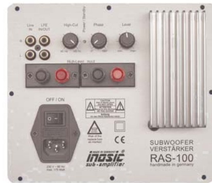
RAS 100 ( 210 x 180 )