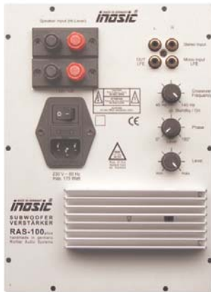
RAS100plus ( 240 x 175 )

Subwooferverstärker mit integrierter Frequenzweiche